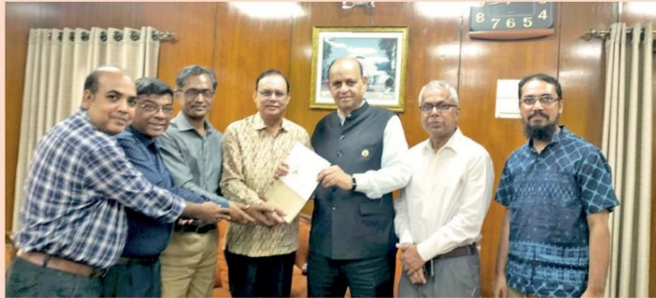
Health Minister Dr Samanta Lal Sen at a meeting with a delegation from PROGGA and ATMA at the secretariat in Dhaka on Wednesday